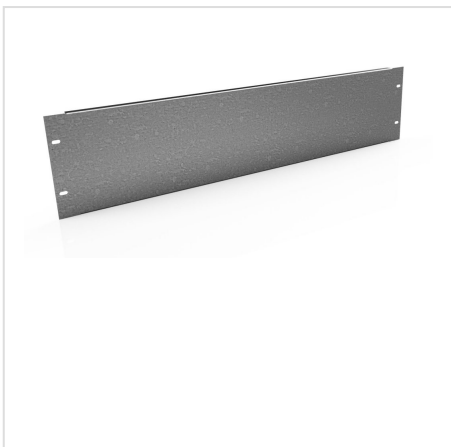
PUA płyta montażowa uniwersalna